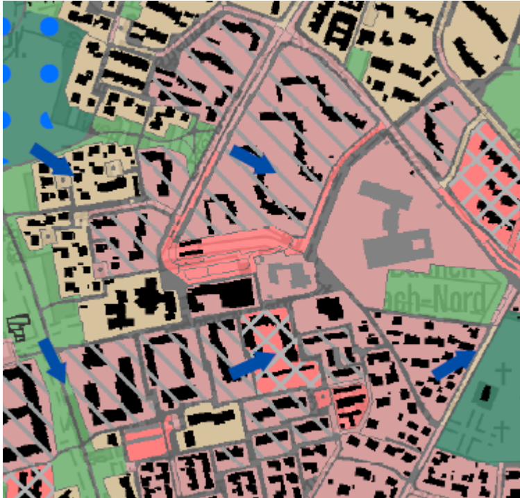
Abbildung 2: Ausschnitt Planungshinweiskarte Nacht, Klimaanpassungskonzept Stadt Erlangen 2019

Diese wird folgendermaßen definiert: Maßnahmen zur Verbesserung der thermischen Situation sind notwendig. Hoher Bedarf an Anpassungsmaßnahmen wie zusätzlicher Begrünung und Verschattung sowie ggf. Entsiegelung. Dies gilt auch für Flächen des fließenden und ruhenden Verkehrs (insb. Fuß- und Radwege sowie Plätze). Ausreichend Ausgleichsräume sollten fußläufig gut erreichbar und zugänglich sein.