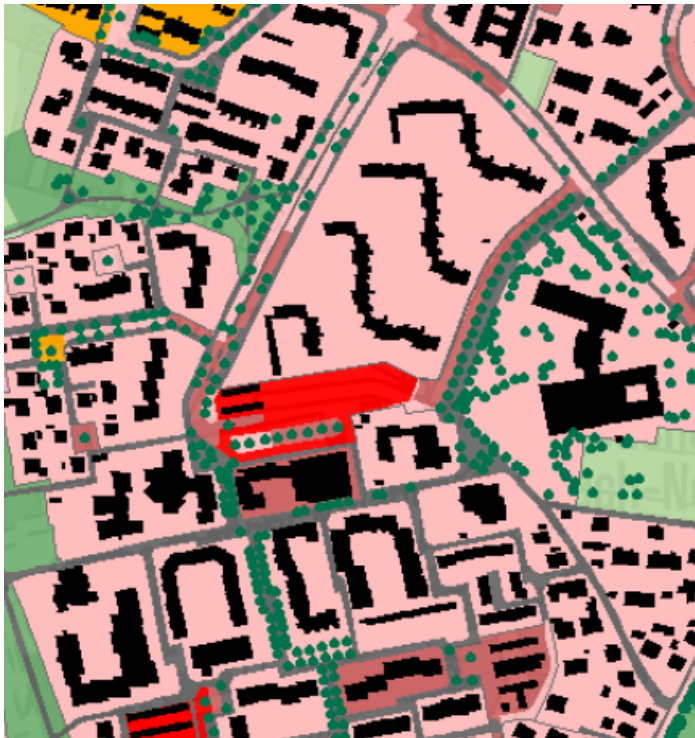
Abbildung 1: Ausschnitt Planungshinweiskarte Tag, Klimaanpassungskonzept Stadt Erlangen, 2019

Das Klimaanpassungskonzept der Stadt Erlangen von 2019 stellt eine Modellrechnung für das unmittelbare Plangebiet dar.